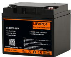
鋰電池 Lithium Battery